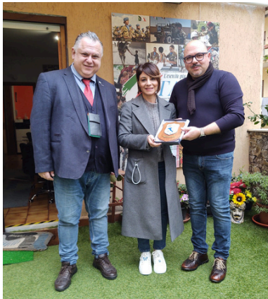
In visita al Terrazzo degli eroi la Senatrice Dolores Bevilacqua.